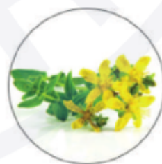
Экстракт зверобоя обыкновенного