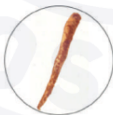
Экстракт корня репейника