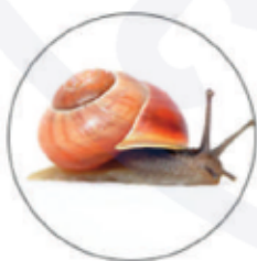
Фильтрат секреции улитки