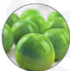
Экстракт плодов абрикоса японского

Активные компоненты и действие сыворотки с АГК pH 3.5