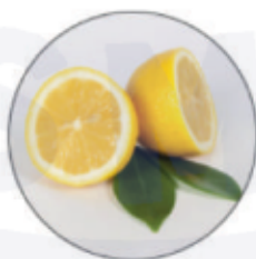
Масло лимонной цедры