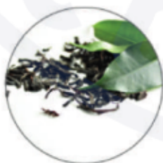
Масло семян китайской камелии