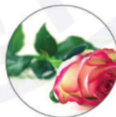
Масло цветков дамасской розы