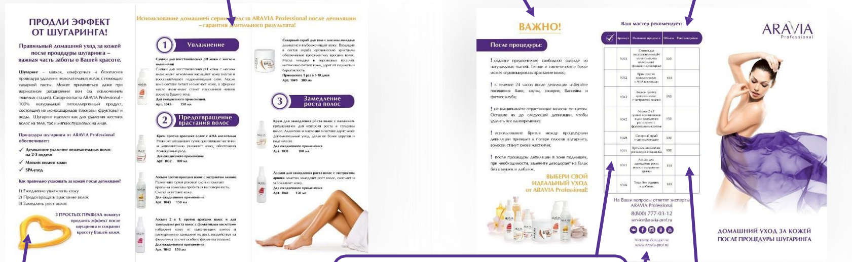
Таблица рекомендаций мастера для приобретения и применения клиентом средств для домашнего ухода

Блок для выделения продукции, необходимой Вашему клиенту дома (заполняет мастер)