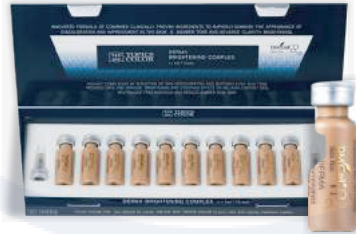
Дерма осветляющий Derma Brightening No. 23