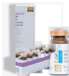
Этап регенерации 3GF BTK комплекс эссенция