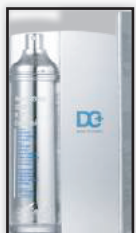
Этап ухода за пористой кожей Интенсивная 3GF VTX эссенция 8%