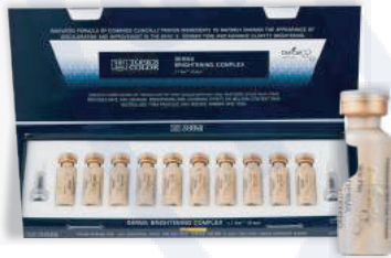
Дерма осветляющий Derma Brightening No. 21