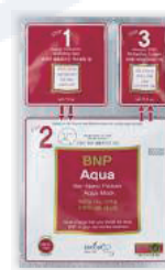
Этап обеспечения питательных веществ BNP Аква маска