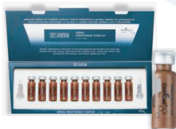
Дерма осветляющий Derma Brightening No. 27