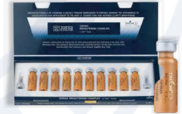
Дерма осветляющий Derma Brightening No. 25