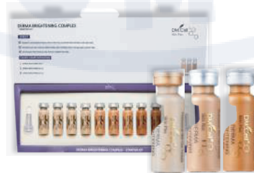
Дерма осветляющий Derma Brightening Starter Kit (No.21 / No.23 / No.25)