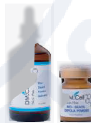
Этап лечения Экзополарный комплект био-сисил