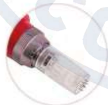
Регулировка длины иглы от 0,25 до 3,0 мм

Фракционная микроигольчатая терапия позволяет в максимально короткие сроки проводить обработку большой площади кожи. При этом регуляция длины иглы на разных участках даёт возможность проводить комплексную микроигольчатую терапию.