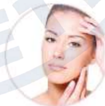
Улучшение внешнего вида кожи после первых процедур