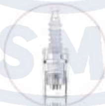
Стерильные картриджи на 12 или 36 игл с лазерной заточкой