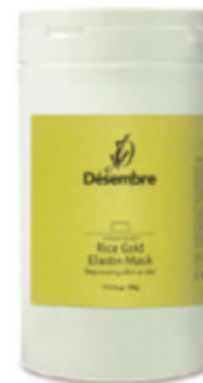
Эластиновая маска на основе риса и золота Rice Gold Elastin Mask 500 г

Декстрин: углевод, который вырабатывается в результате гидролиза крахмала. При контакте с водой становится вязким, обеспечивая уход за порами и эффект лифтинга. Альгин: компонент, добываемый из морских водорослей. Разглаживает текстуру кожи.