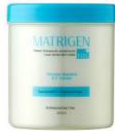
매트리젠 고주파 크림(R.F 크림) MATRIGEN R.F CREAM 美特丽珍高射频霜(RF霜)

含有芦荟叶提取物和桑白皮提取物成分，具有镇定作用的啫喱产品。可以作为配合仪器使用的超声波啫喱使用