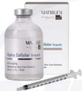
매트리젠 하이dra 셀룰러 앰플 MATRIGEN HYDRA CELLULAR AMPOULE 美特丽珍玻尿酸注射安瓶

구성/Composition/构成 : 50ml 주사기/Syringe/注射器 6ea