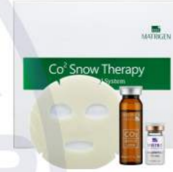
매트리젠 CO2 스노우 테라피 MATRIGEN CO2 SNOW THERAPY 美特丽珍 CO2 二氧化碳雪花焕肤

茶树成分, 北美金缕梅成分, 对敏感皮肤起到镇定作用, 有缓解痘痘, 收敛毛孔, 平衡皮肤Ph值, 净化毛孔作用的面膜粉