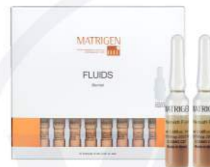
매트리젠 블레미쉬 플루이드 MATRIGEN BLEMISH FLUID 美特丽珍驻颜粉底安瓶

乳酸(AHA), 白藜芦醇, 多酚等成分, 可以有效的去除皮肤的角质和废弃物, 使粗糙的皮肤更加细致, 去角质安瓶产品