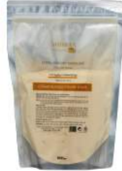
매트리젠 안티에이징 & 디톡싱 모델링 마스크 MATRIGEN ANTI-AGING & DETOXING MODELING MASK. 美特丽珍 抗衰老&排毒面膜粉

脸部整体无遗漏贴敷, 吸收效果好, 可以将有效的成分传达到皮肤深层, 使皮肤亮白水润的面膜粉产品