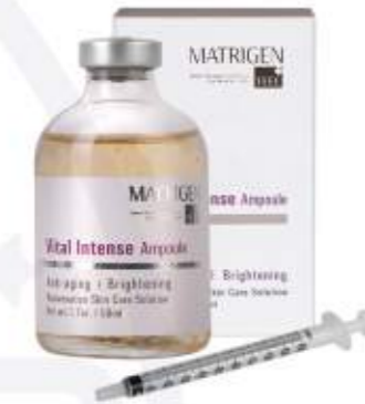
매트리젠 바이탈 인텐스 앰플 MATRIGEN VITAL INTENSE AMPOULE 三文鱼多肽注射安瓶

改善油性皮肤效果显著的积雪草提取物, 茶树提取物, 羟基积雪草甙等成分, 可以镇定舒缓皮肤. 改善皮肤的水油平衡, 抑制过多皮脂分泌的舒缓安瓶.