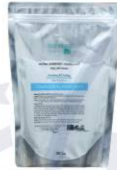
매트리젠 수딩 & 쿨링 모델링 마스크 MATRIGEN SOOTHING & COOLING MODELING MASK 美特丽珍 舒缓&清凉面膜粉