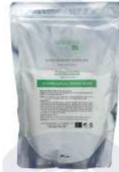
매트리젠 퓨리파잉&수딩 모델링 마스크 MATRIGEN PURIFYING & SOOTHING MODELING MASK 美特丽珍 修复&舒缓 面膜粉

辣薄荷提取物成分, 给予皮肤清凉感. 可以快速缓解浮肿, 镇定皮肤的舒缓清凉面膜粉