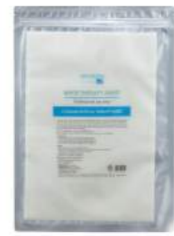
매트리젠 화이트 테라피 MATRIGEN WHITE THERAPY 美特丽珍 白雪焕肤

氧气和二氧化碳的交换过程(波耳氏效应, 供给新鲜氧气, 促进血液循环. 排出皮肤内的废弃物, 精华毛孔, 提亮肤色的碳酸泡沫面膜