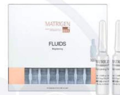
매트리젠 브라이팅 플루이드 MATRIGEN BRIGHTENING FLUID 美特丽珍美白安瓶

不同于我们一般使用的安瓶产品, 不仅有美白效果, 还含有粉底遮瑕成分, 可改善斑点和暗沉皮肤的安瓶产品. MTS一起使用, 可以将有效的成分渗透到皮肤深处, 起到保湿和镇定作用, 打造湿润有光泽的皮肤