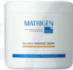
매트리젠 발란스 마사지 크림 MATRIGEN BALANCE MASSAGE CREAM 美特丽珍平衡按摩霜

高射频的深部热效果可以直达皮肤真皮层，可以配合仪器使用起辅助效果的专用霜。高射频仪器使用时，可以防止产生电火花的安全。