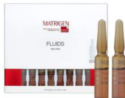
매트리젠 와인 필 플루이드 MATRIGEN WINE PEEL FLUID 美特丽珍红酒去角质安瓶