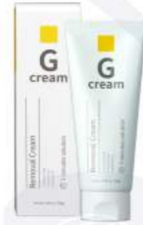
매트리젠 헤어 리무버 크림(G크림) MATRIGEN HAIR REMOVER CREAM(G CREAM) 美特丽珍脱毛膏(G脱毛膏)

可以配合按摩的专用霜，含有维他命等丰富成分，供给皮肤营养，促进皮肤再生的按摩专用霜