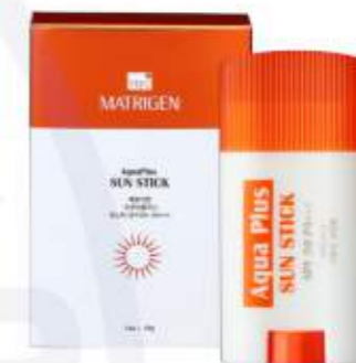
매트리젠 아쿠아 플러스 썬스틱 MATRIGEN AQUA PLUS SUN STICK 美特丽珍补水防晒棒

物理性太阳光反射原理, 阻断紫外线的防晒产品。不会被皮肤吸收, 对皮肤无刺激, 无负担的亮白防晒霜