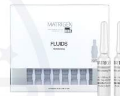
매트리젠 모이스춰라이징 플루이드 MATRIGEN MOISTURIZING FLUID 美特丽珍补水安瓶