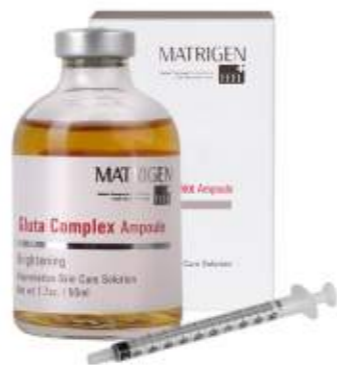
매트리젠 글루타 콤플렉스 앰플 MATRIGEN GLUTA COMPLEX AMPOULE 美特丽珍白玉注射安瓶

구성/Composition/构成 : 50ml 주사기/Syringe/注射器 6ea