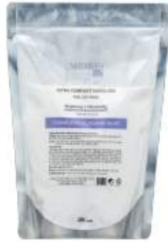
매트리젠 브라이팅 & 모이스춰라이징 모델링 마스크 MATRIGEN BRIGHTENING & MOISTURIZING MODELING MASK 美特丽珍 美白&补水面膜粉