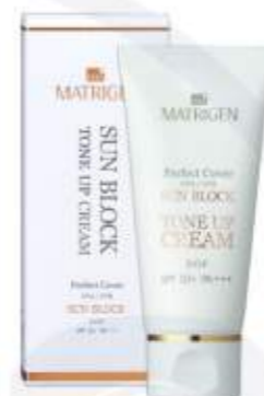
매트리젠 선블럭 톤 업 크림 MATRIGEN SUN BLOCK TONE UP CREAM 美特丽珍防晒霜