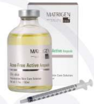
매트리젠 아크네 프리 액티브 앰플 MATRIGEN ACNE FREE ACTIVE AMPOULE 美特丽珍茶树积雪草注射安瓶

可以聚集比自己重量1000倍以上水分的7种玻尿酸成分, 使肌肤无遗漏完美保湿锁水安瓶