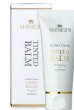
매트리젠 틴티드 밤 MATRIGEN TINTED BALM 美特丽珍再生BB霜

无论何时何地便利的涂抹, 阻断紫外线, 保护皮肤的防晒棒。无浮白, 干净方便使用, 固体防晒棒