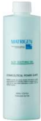
매트리젠 알로에 수딩젤 MATRIGEN ALOE SOOTHING GEL 美特丽珍芦荟胶舒缓啫喱