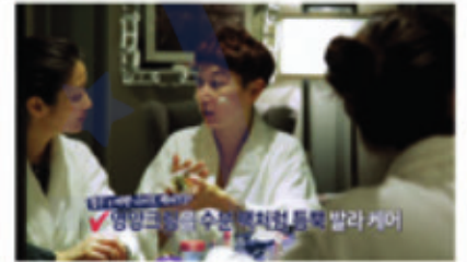
Gold Duck's EGO GDII в телешоу «Women Plus»