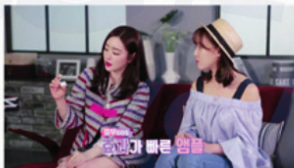
Transfusion DNA Kit в телешоу «Beauty Island»