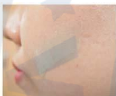
Moist and fresh spreadability