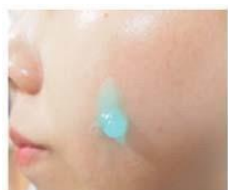
Blue soft gel type

❖ Эффект “Капли воды”, глубокое увлажнение для всех типов кожи