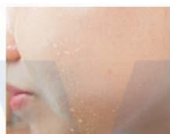
Water drop appearance